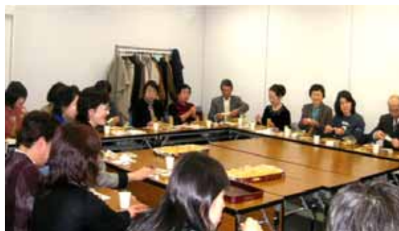
<懇親会を楽しむ会員>

総会后、アメリカ南部渡航(昨年)のビデオを観たあと、お弁当、フルーツをいただきながらの懇親会が開かれました。これまでの交流体験について一言ずつお話しいただき、時には爆笑を誘う発言もあり、和気藹々の楽しいひとときを過ごしました。